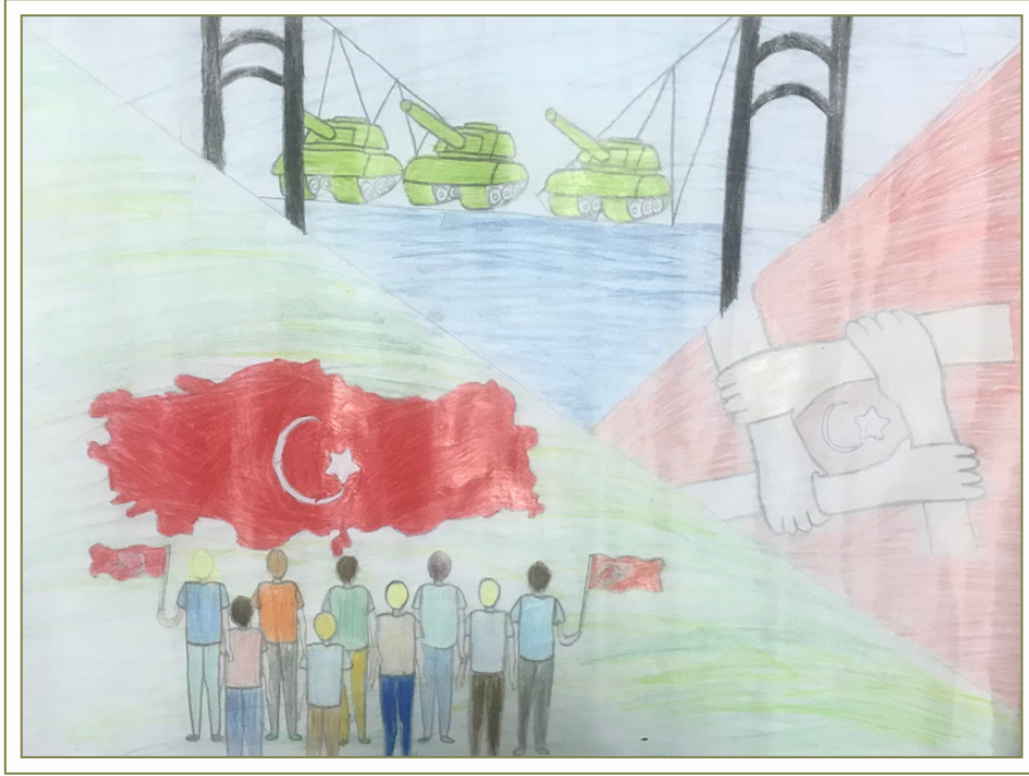
7A Sınıfı - Ecrin KOCATEPE